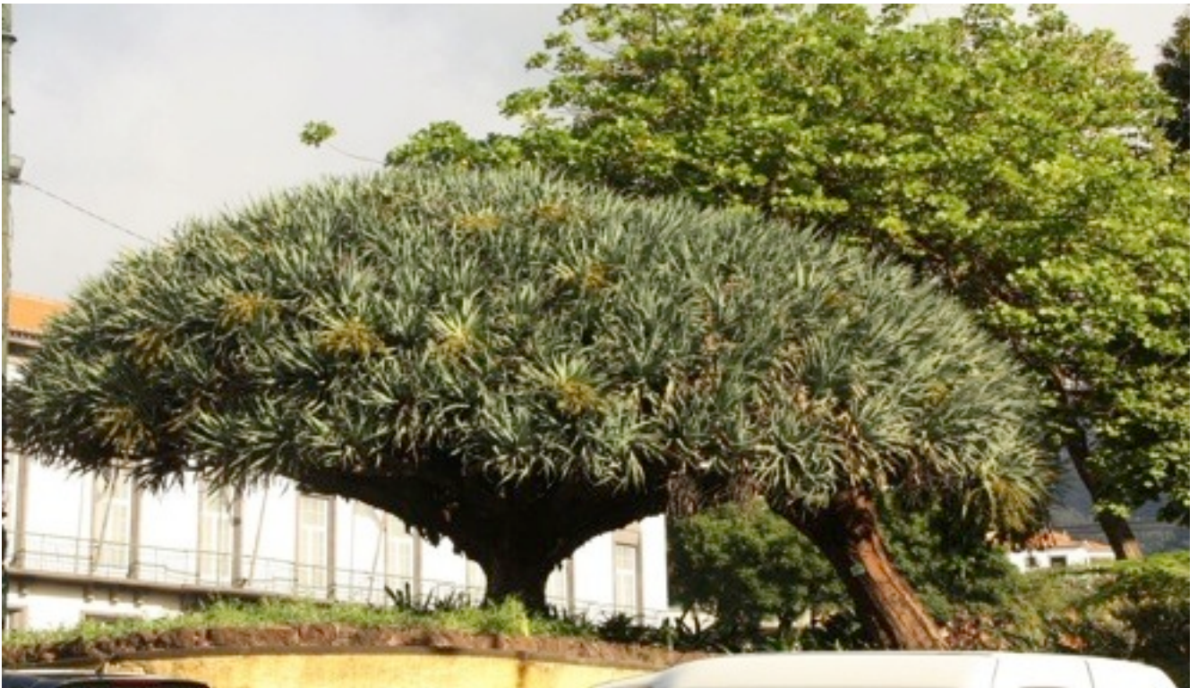
31. Dracaena draco リュウケツジュ