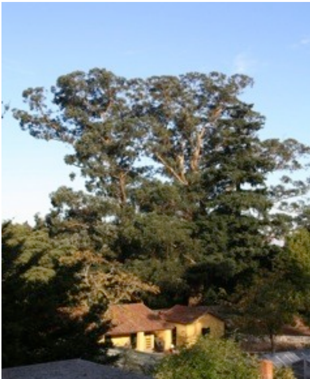
25. Eucalyptus globulus ユーカリ