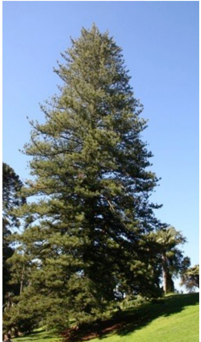
19. Araucaria heterophylla コバノナンヨウスギ