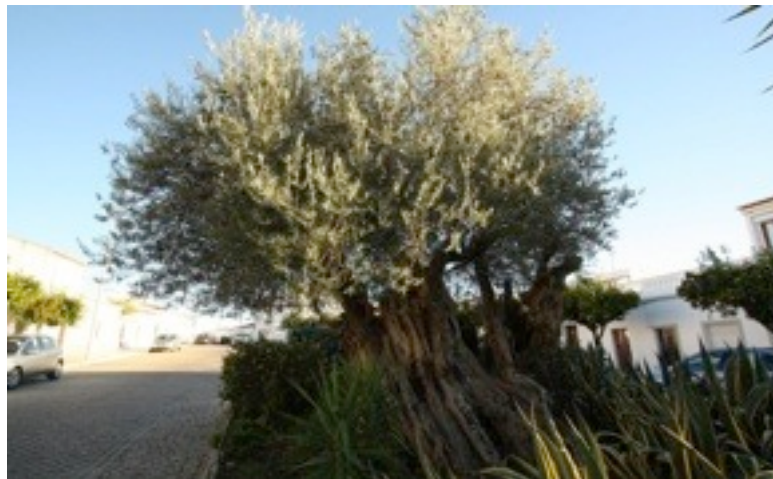
6. Olea europaea オリーブ