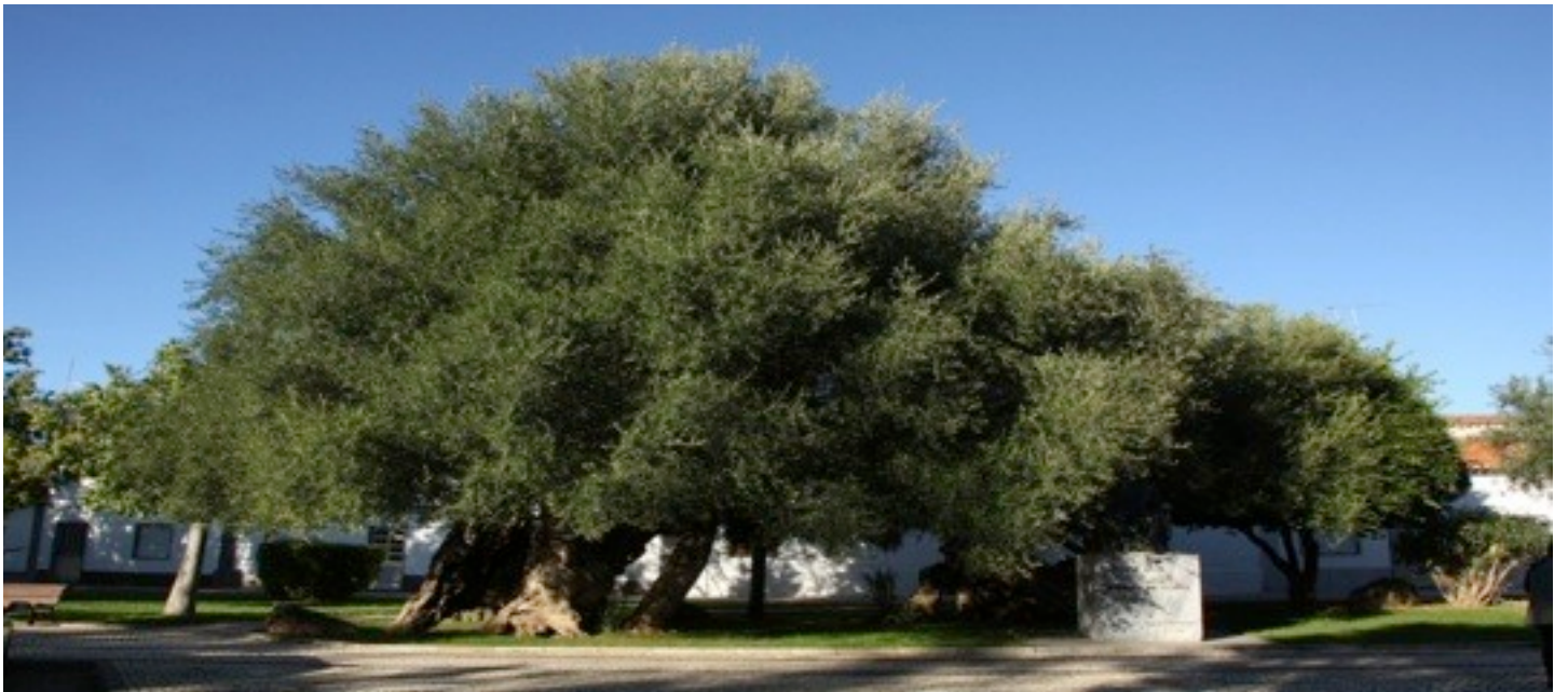
4~5. Olea europaea オリーブ