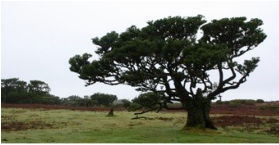
35. Laurus novocanariensis