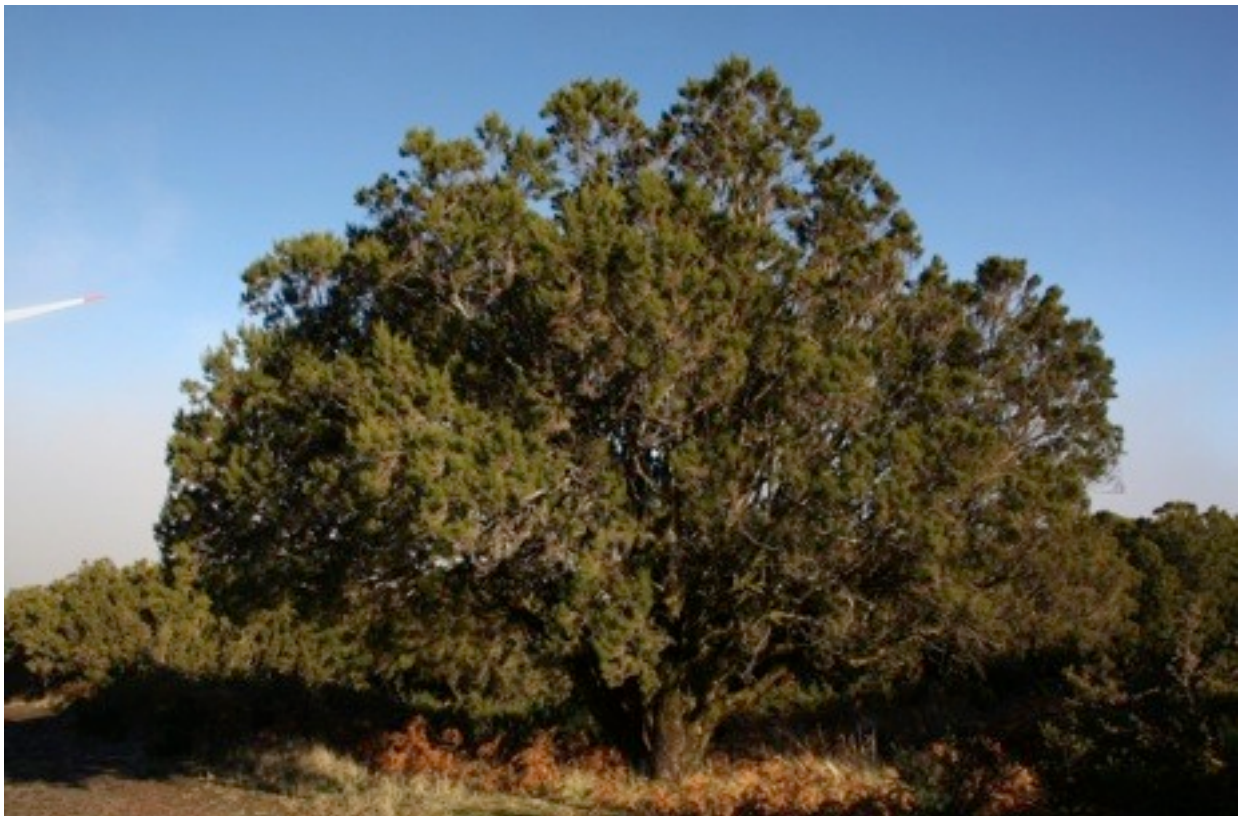
34. Erica arborea エイジュ