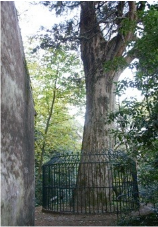
23. Cupressus macrocarpa モントレーイトスギ