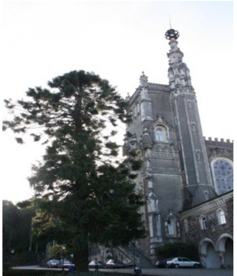
24. Araucaria bidwillii ヒロハノナンヨウスギ