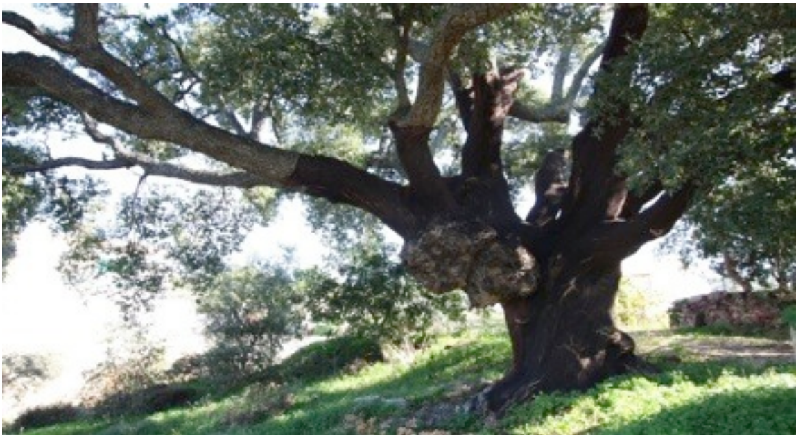
15. Quercus suber コルクガシ