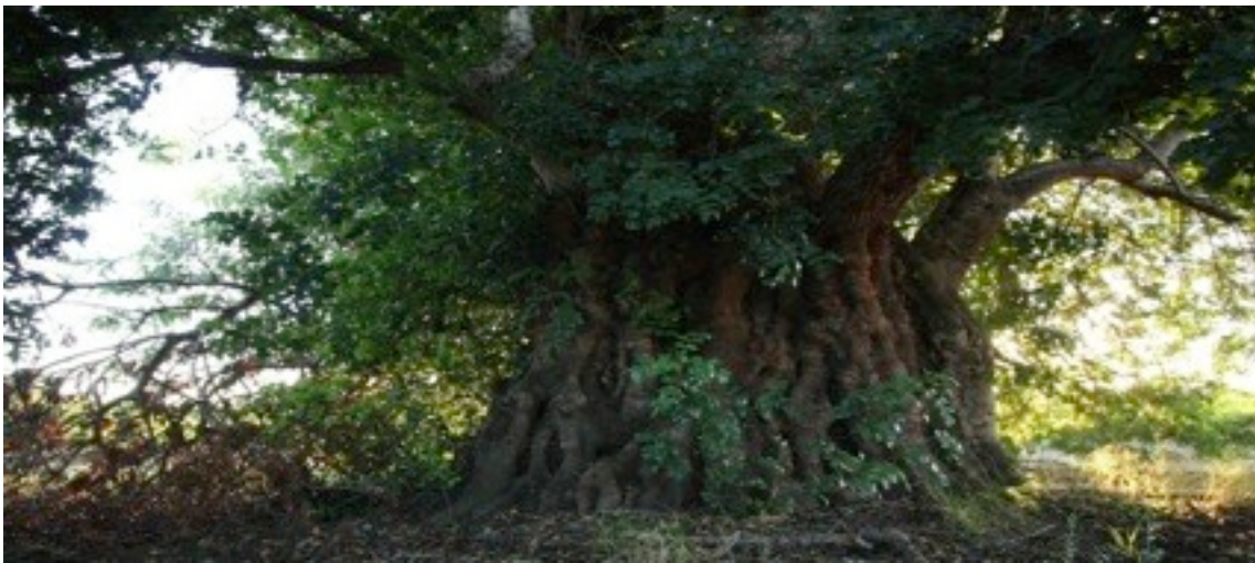
10. Ceratonia siliqua イナゴマメ