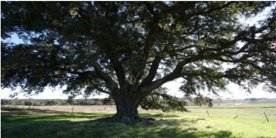
16. Quercus suber コルクガシ