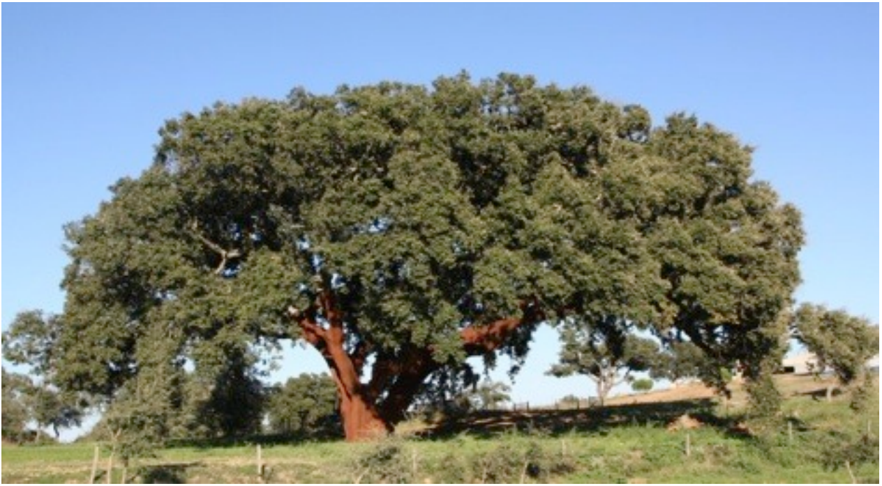
17. Quercus suber コルクガシ