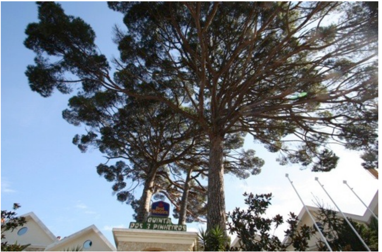
27. Pinus pinea イタリアカサマツ