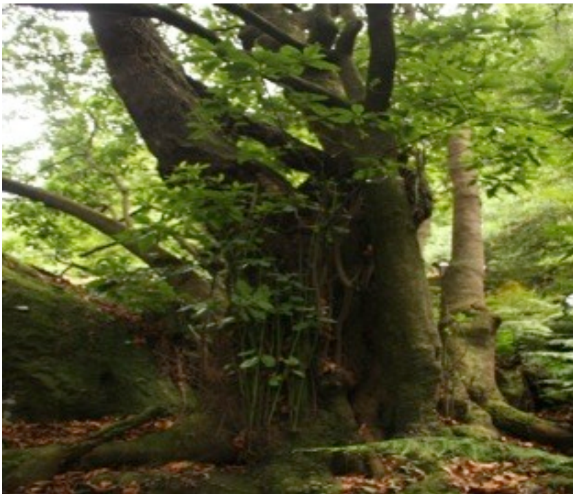
37. Persea indica