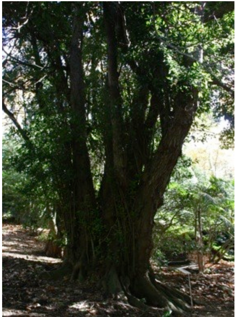
22. Ocotea foetens