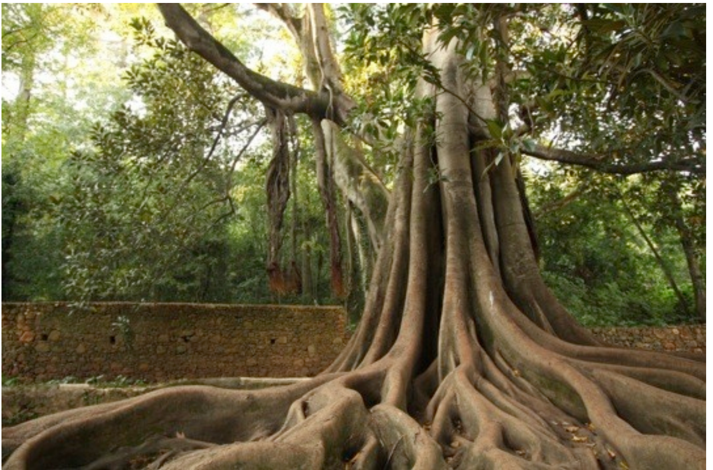
28. Ficus macrophylla オオバゴム