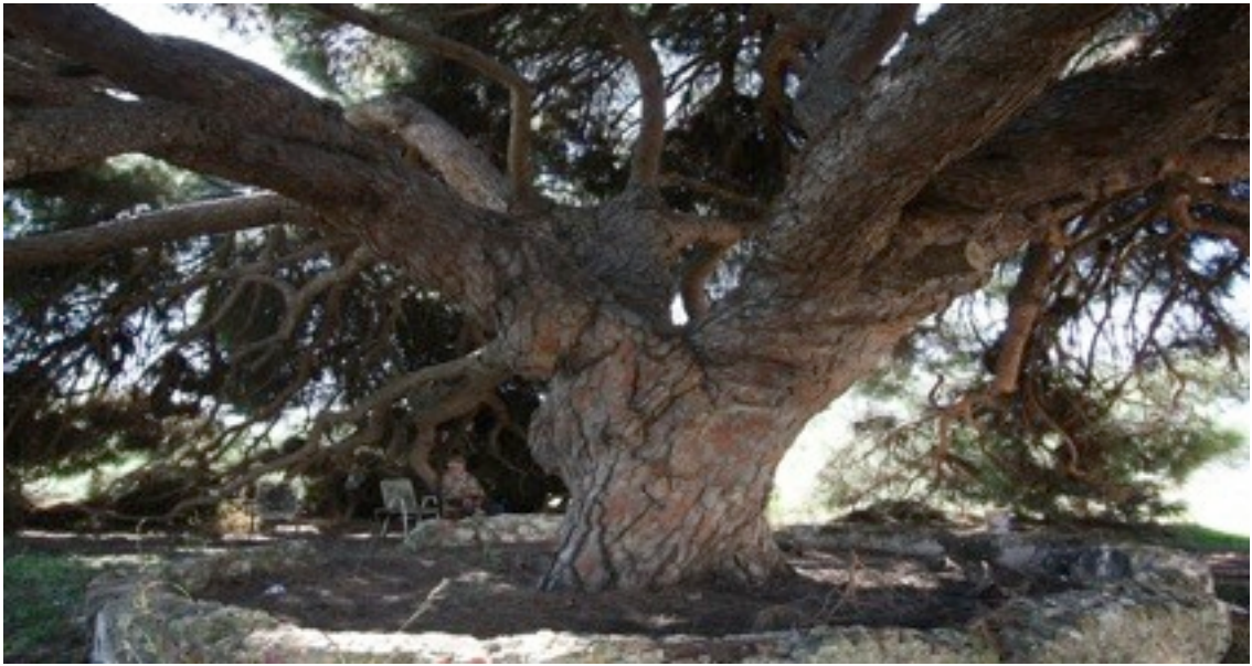
14. Pinus pinea イタリアカサマツ