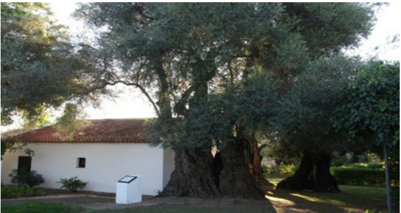
11~13. Olea europaea オリーブ