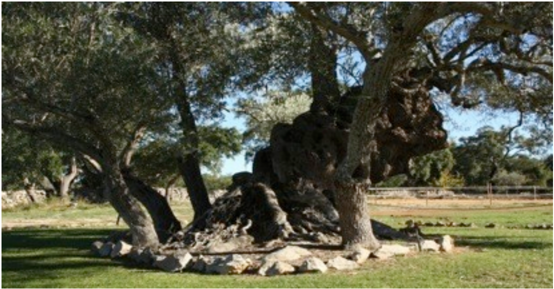
9. Olea europaea オリーブ