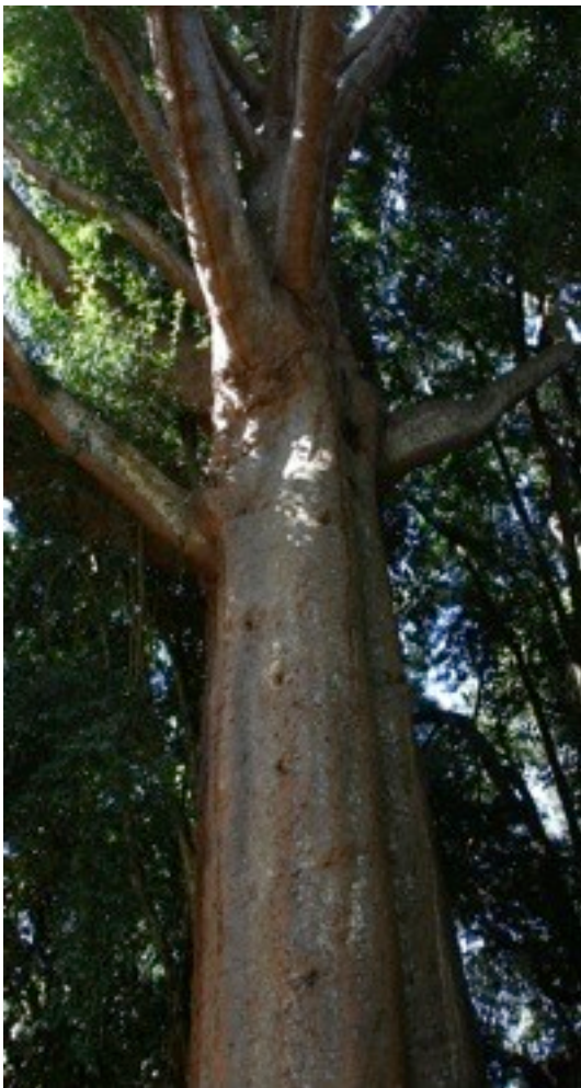
21. Agathis brownie オニカウリマツ