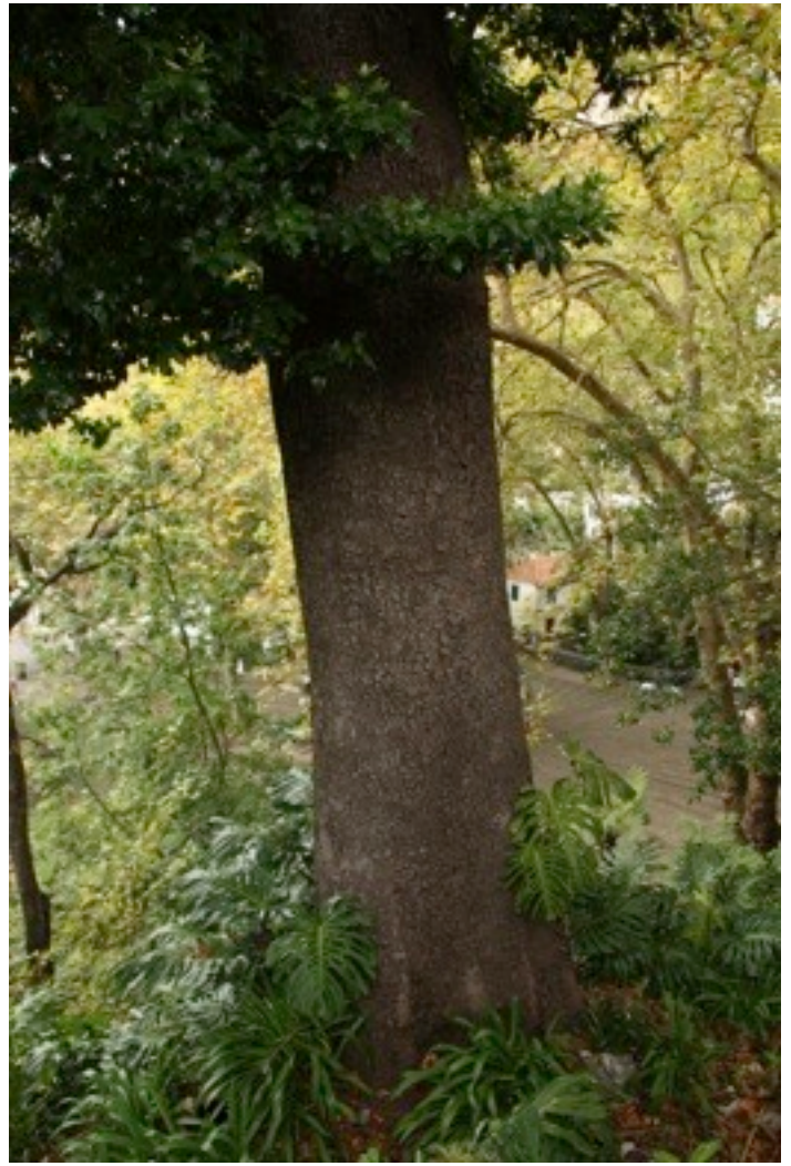
32. Chorisia speciosa トックリキワタ