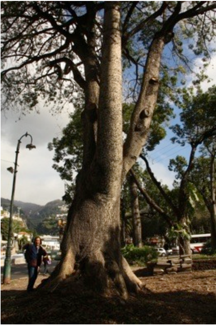
33. Ocotea foetens