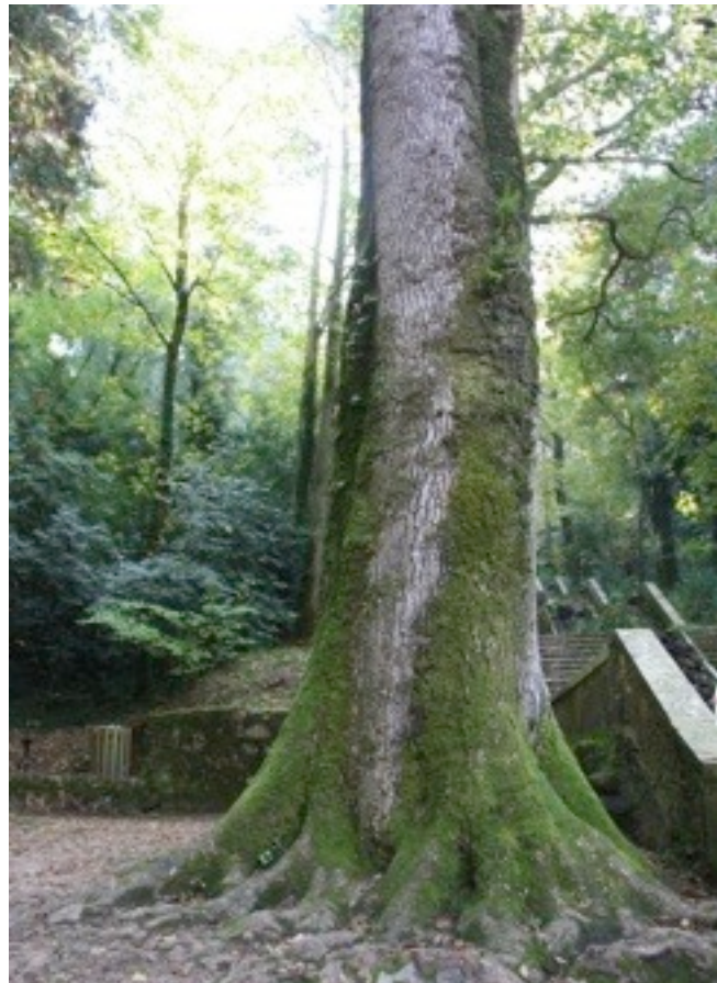
26. Fraxinus excelsior セイヨウトネリコ