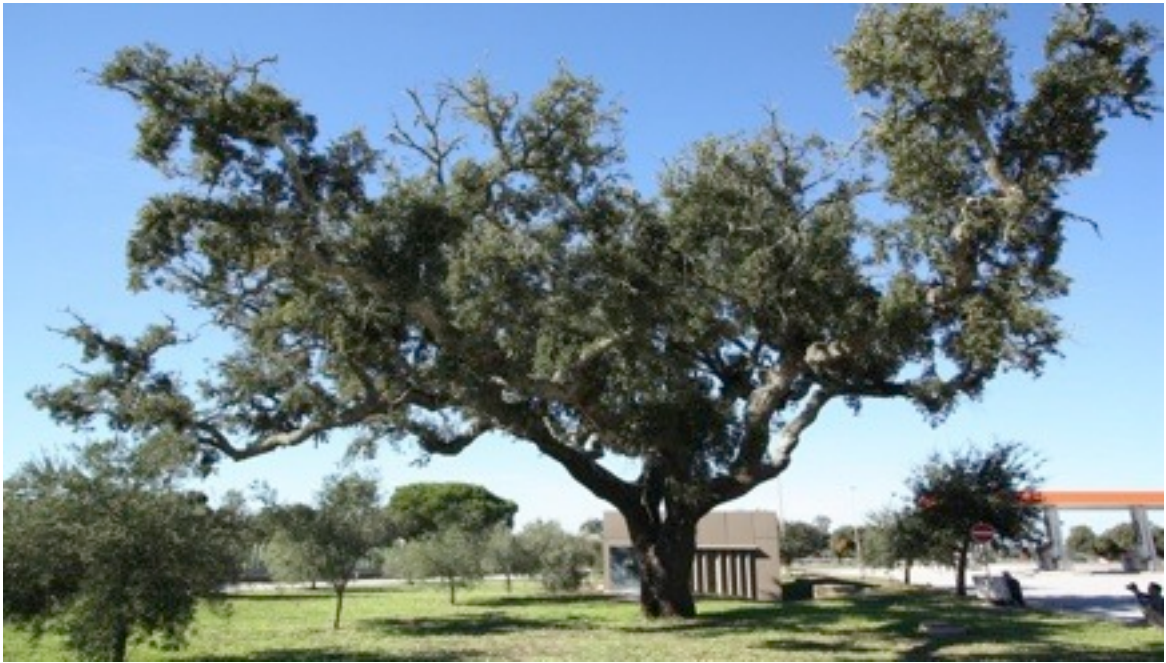
3. Quercus suber コルクガシ