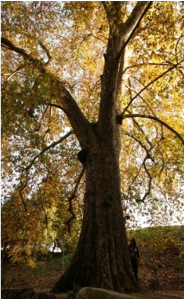
29. Platanus x acerifolia モミジバスズカケノキ