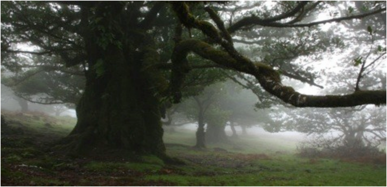
36. Ocotea foetens