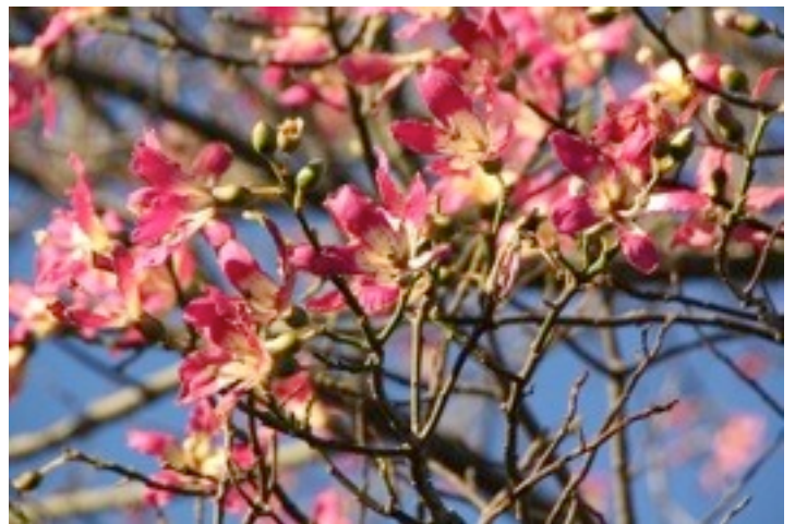
2. Chorisia speciosa トックリキワタ