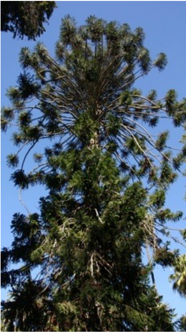
18. Araucaria bidwillii ヒロハノナンヨウスギ