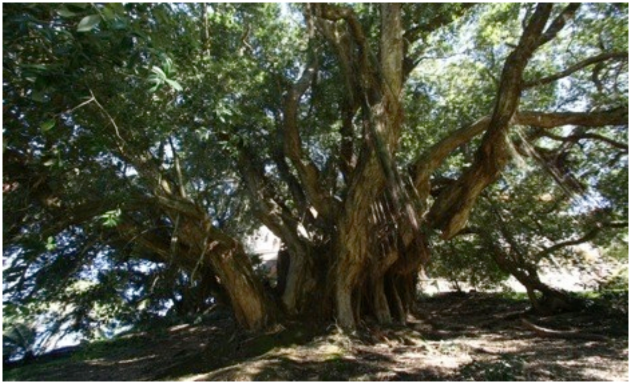
20. Metrosideros excelsa