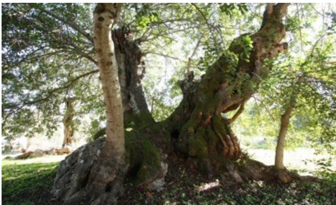
8. Ceratonia siliqua イナゴマメ