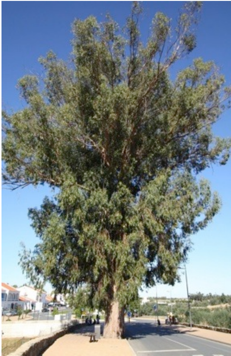
7. Eucalyptus globulus ユーカリ