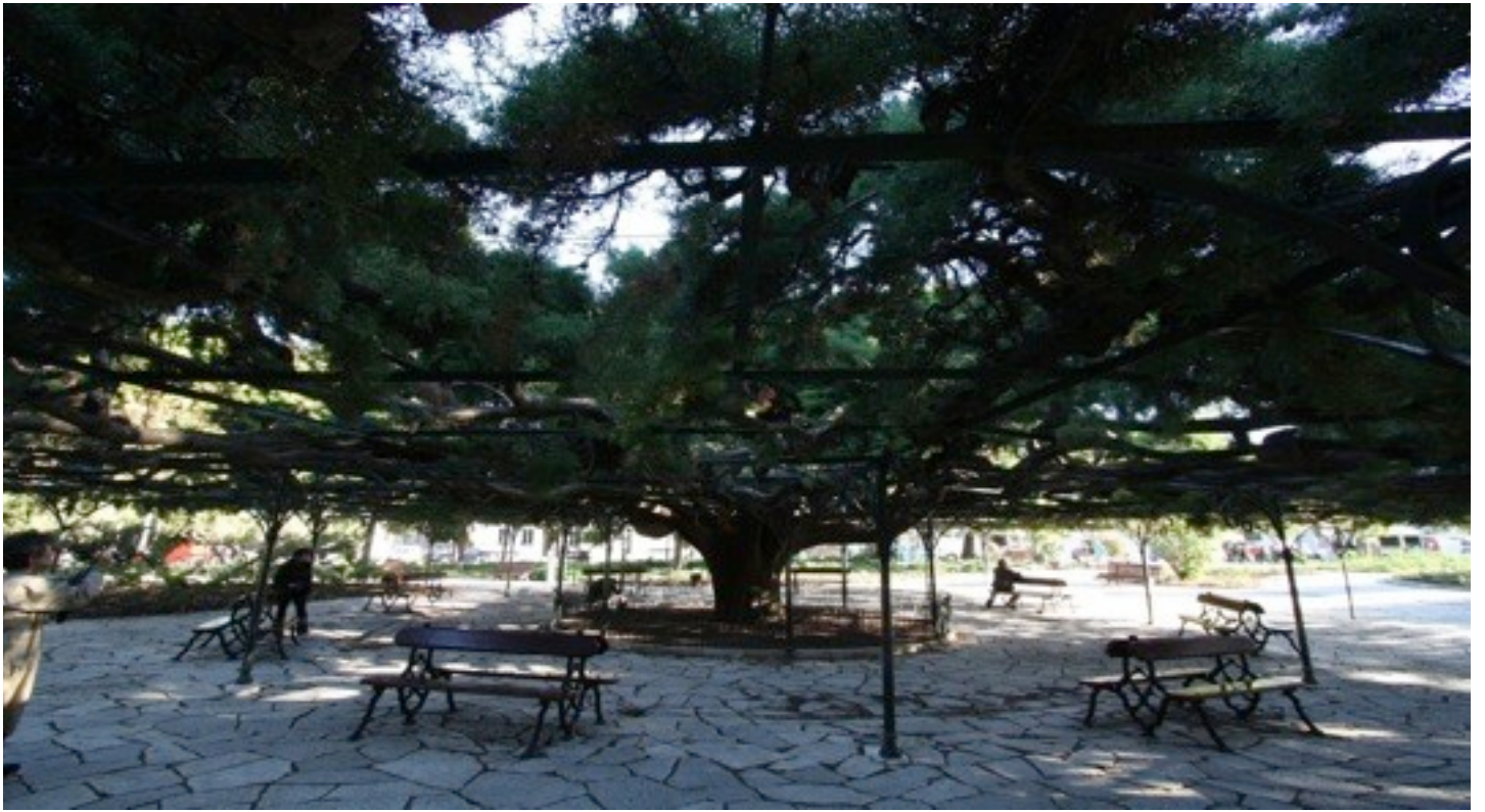
1. Cupressus sempervirens イタリアイトスギ