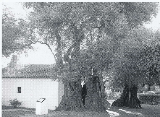
樹齢千年といわれるオリーブの巨樹 (No.11)