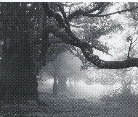
Ocotilla foetens (No.36)

アレンテージョ地方〜アルガルヴェ地方は、なだらかな地形のもと広大なコルクガシの畑が広がっており、そのなかで特に大きく巨木になっているもの(No.3, No.15~17)を訪ねました。コルクガシの樹皮からワインの栓などに用いるコルクを採取するのですが、世界のおよそ50%のコルクはポルトガルで採取されるそうです。樹皮を剥いだばかりの木の幹肌は鮮やかな褐色をしています。この地域では他に樹齢千年といわれるオリーブの巨樹(No.11)や古い時代に東地中海から渡来したといわれるイナゴマメの巨樹(No.8, No.10)なども訪ねました。