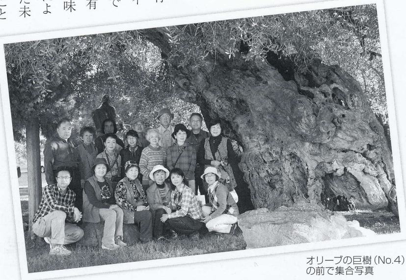
オリーブの巨樹 (No.4) 前で集合写真

ラウルシルバにはこれらのほか、アボカドと同属で「マデイラ・マホガニー」とよばれている Persea indica （No. 37）やイスノキのように葉に虫嬰 ちゅうよう をつけるのが特徴の Apollonias barbujana （クスノキ科）や Clethra arborea （リョウブ科）、 Piconia excelsa （モクセイ科）などの木々が交じり合っており生育しています。これらの樹種はマデイラ島やカナリア諸島にしかないものです。島内に生えている他の植物も固有種か準固有種が非常に多くとも興味深い島でした。現地のガイドさんによるとラウルシルバの中にはまだまだ未知の巨樹巨木が沢山あるだろうとのことでした。